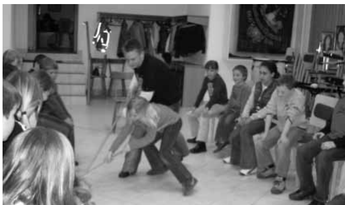
Spieleabend! Hier spielen wir gerade Hausfrauenfußball!!!