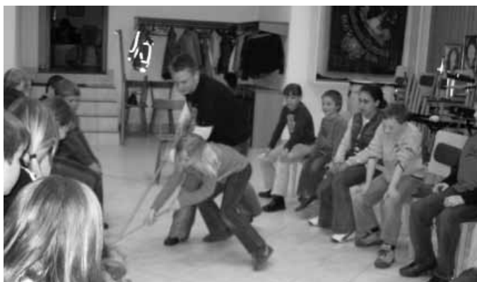
Spieleabend! Hier spielen wir gerade Hausfrauenfußball!!!